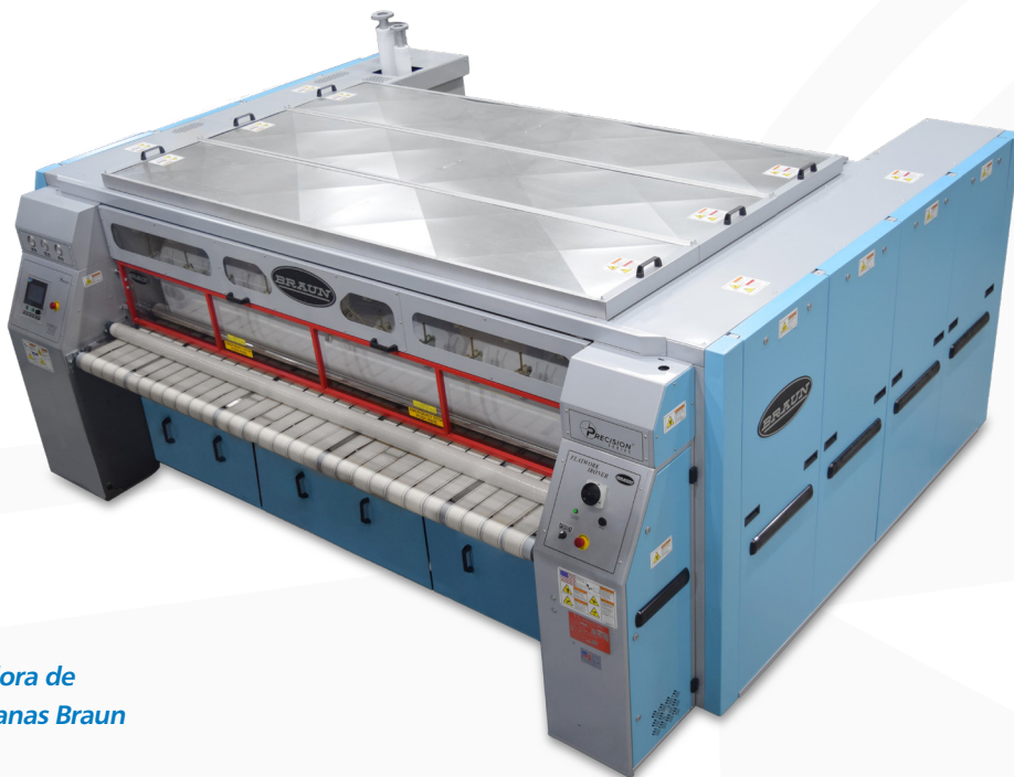
Planchadora de piezas planas Braun

Braun fabrica las planchadoras Serie Precision con calentamiento de superficie profunda para el planchado y rodillos de amplio diámetro para dar un excelente acabado a las piezas planas. Esta planchadora de sólida construcción puede incluir desde uno y hasta cuatro rodillos y está equipada con sistema de calentamiento de vapor o líquido termal. Estas máquinas pueden ser ordenadas en anchos de 120 o 130 pulgadas. La construcción modular permite agregar rodillos en campo. Estas características en el diseño de Braun aseguran que la producción de planchado esté a la par del flujo de todo su sistema de lavandería.